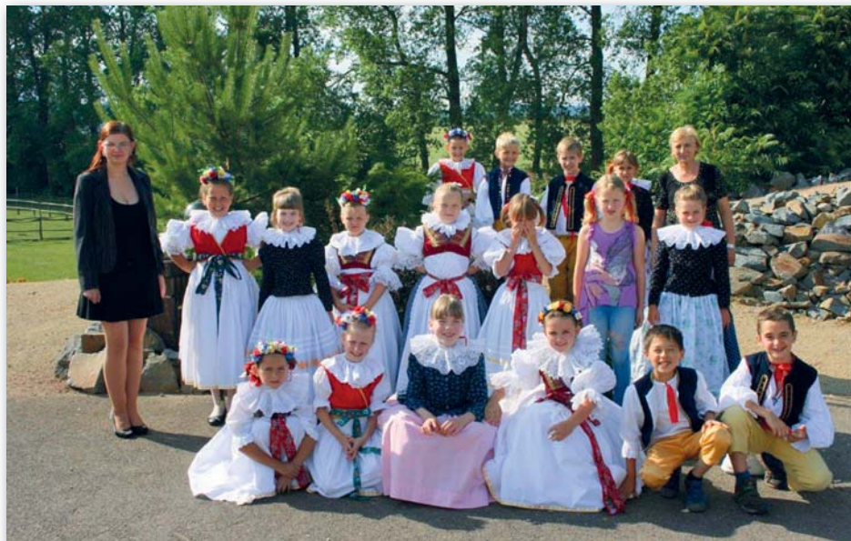
vystoupení pro Rompu