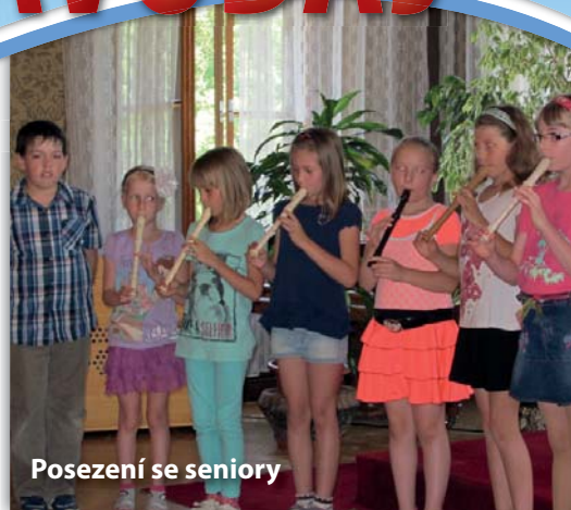
Posezení se seniory