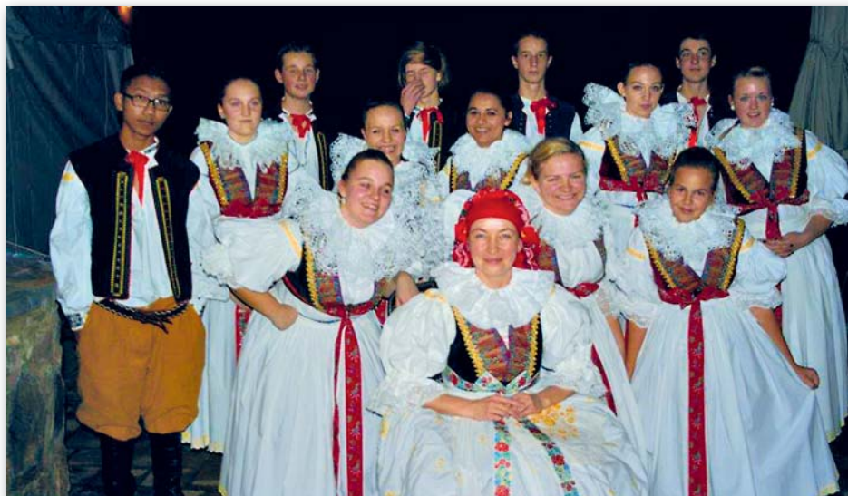
krojování tančí pro Rompu