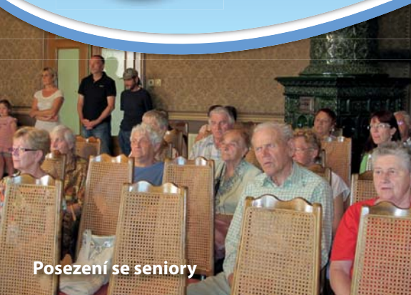
Posezení se seniory