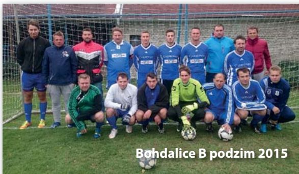
Bohdalice B podzim 2015