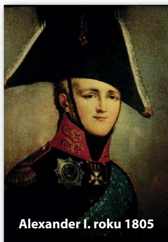
Alexander I. roku 1805

Sobotní program by nabitý a každý si v něm mohl najít, co srdce ráčilo. Již dopoledne byla rytířská pohádka pro nejmenší. Následoval hlavní bod programu, slavnostní příjezd evropských mocnářů. První přijel rakouský císař František I. a za ním panovník největší říše na světě car Alexander I.. K poctě ruského cara vystoupil národopisný soubor Sudarušky a zazpíval převážně ukrajinské písně v ukrajinských národních krojích. V programu pokračovala umělecká skupina Poustevník, která předvedla představení SNY. Opadané nazlátlé listí naší staříčké lípy vytvořilo velkolepé pozadí pro celou historicko-taneční hru.