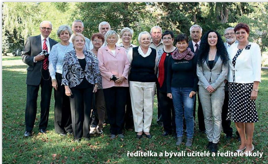
ředitelka a bývalí učitelé a ředitelé školy