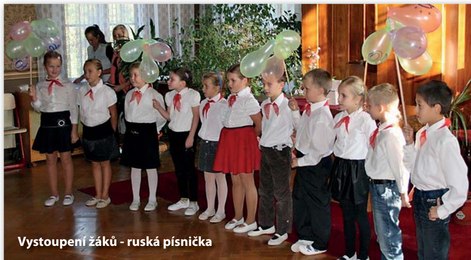
Vystoupení žáků - ruská píseňka